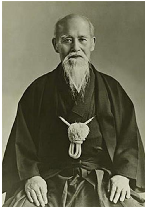
Zdjęcie O Sensei Morihei Ueshiba

Aikikai Hombu Dōjō – kwatera główna Fundacji Aikikai w Tokio. W 1968 drewniane Dojo zostało zastąpione nowoczesnym, betonowym budynkiem. Nowe, pięciopiętrowe Dojo zawiera trzy osobne sale treningowe.