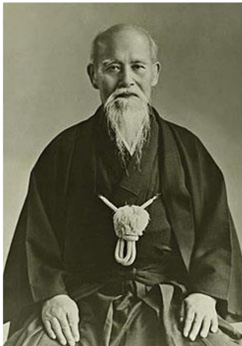
Zdjęcie O Sensei Morihei Ueshiba

Hombu Dojo – główna siedziba światowej Fundacji Aikikai, znajduje się w Tokio